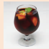
伊予灘サンセットティ