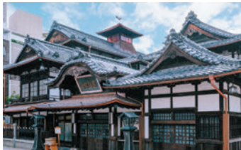
松山市 道後温泉本館