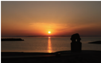
伊予市 ふたみシーサイド公園

約3000年の歴史を誇る道後温泉のシンボルです。国の重要文化財にも指定されています。2024年4月で改築130周年を迎えた歴史的・文化的価値のある建物が魅力です。次世代に引き継ぐため、2019年から、営業しながらの保存修理工事を行っていましたが、2024年7月11日に休憩室も含めた全館営業を約5年半ぶりに再開し、同年12月に工事が完了しました。