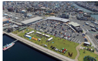
八幡浜市 道の駅・ みなとオアシス 八幡浜みなと

脈川の河畔に臨む大洲城は、鎌倉時代末期に守護として国入りした宇都宮氏が築いた「地蔵ヶ嶽城」が始まりといわれています。高さ19.15mの四層四階の天守は、木造で復元されたものとしては戦後最高の高さとなります。